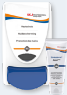
Stokoderm® AQUA PURE