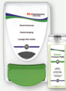
Estesol® PREMIUM PURE