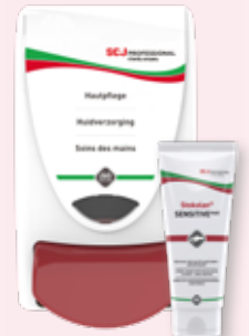
Stokolan® SENSITIVE PURE